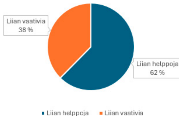
Työtehtäväni ovat: Q1/2026 (n=141 vastausta)