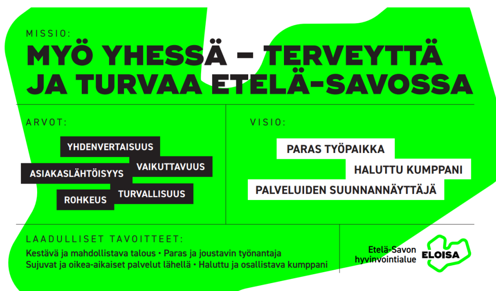
Kuva 1. Hyvinvointialueen strategia.

Arvot kuvaavat merkityksellisyyttä ja tavoiteltavia asioita, jotka ohjaavat toimintaa.